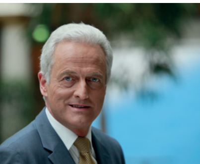
Dr. Peter Ramsauer, MdB Bundesminister für Verkehr, Bau und Stadtentwicklung